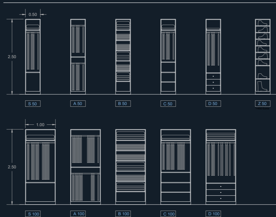
CONFIGURACIONES DE ARMARIOS